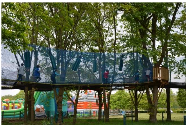
Les joies de l'accrobranche