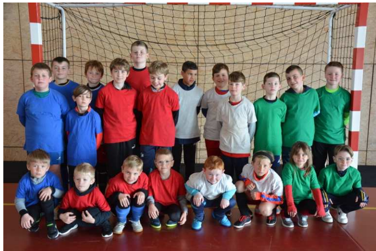
Stage des vacances de Printemps