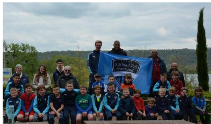
A l'heure du goûter