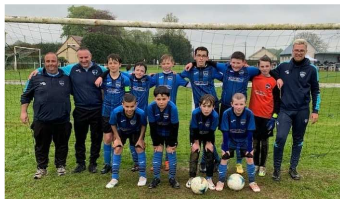
Tournoi U13 à Yébleron