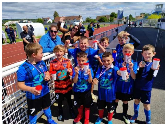
Les U9 à la journée nationale des débutants