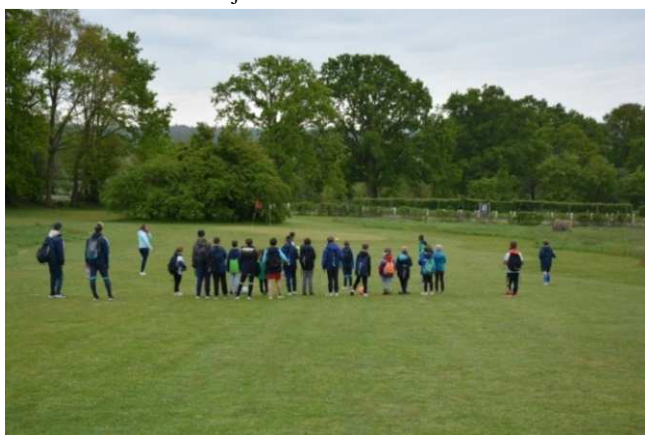
Initiation au foot-golf