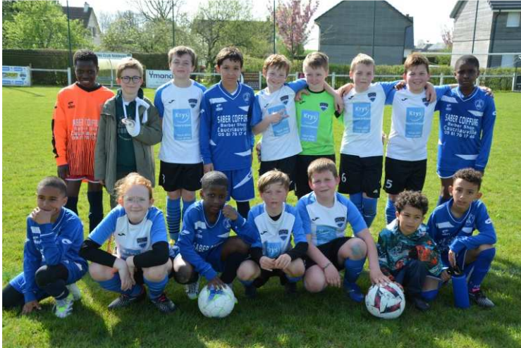
Plateau U11 avec Caucriauville