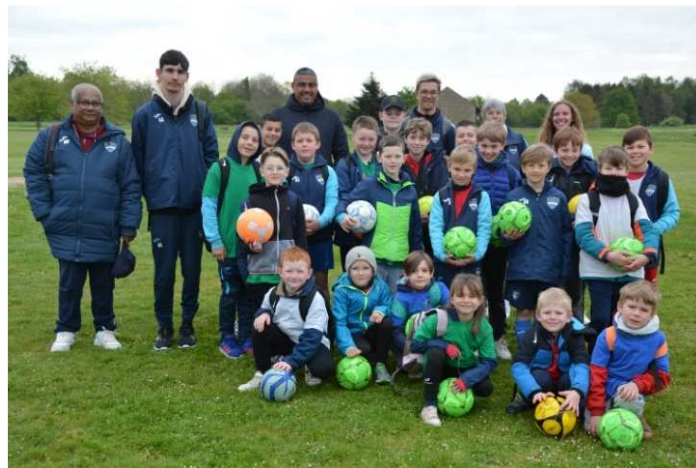
Sortie à la Base de loisirs de Jumièges