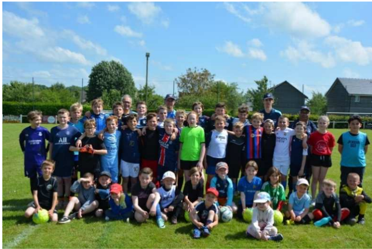
Journée Portes Ouvertes en Juin