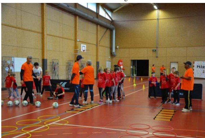
Participation aux Olympiades de l'école