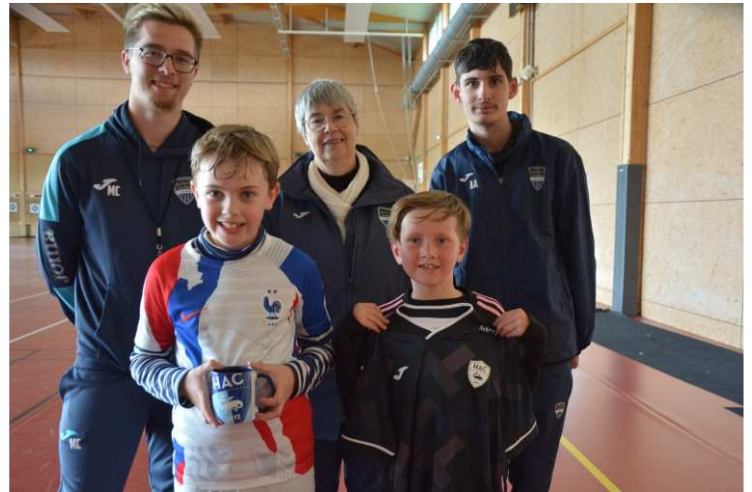
Récompenses pour les jeunes vendeurs de calendriers